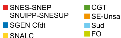
Les élus SNES-SNEP-SNUIPP-SNESUP dans les CAPA pour 2011-2014