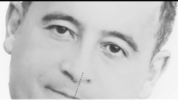
[G. Darmanin, Ministre de l'Action et des Comptes publics]