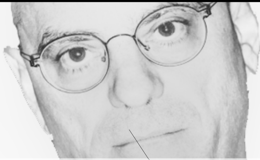
[J.M. Blanquer, Ministre de l'Éducation nationale et de la Jeunesse]