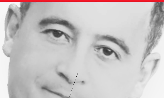
[G. Darmanin, Ministre de l'Action et des Comptes publics]