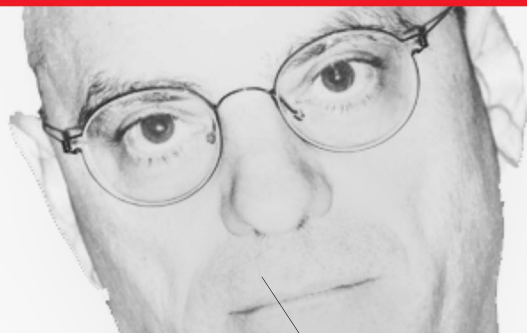
[J.M. Blanquer, Ministre de l'Éducation nationale et de la Jeunesse]